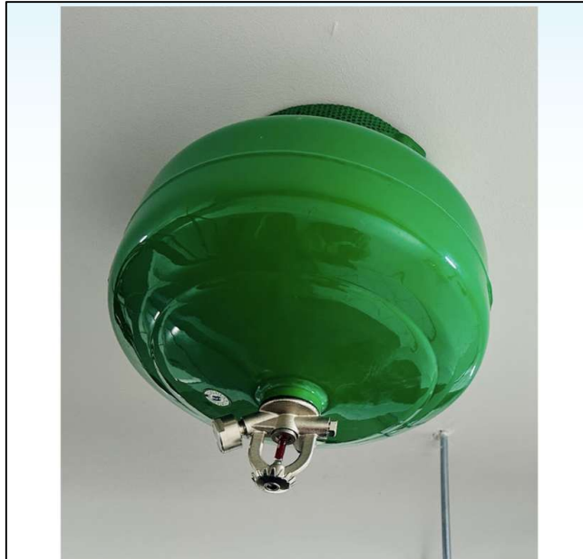
มีเครื่องดับเพลิงถังสีเขียวพร้อมใช้งาน ชนิดติดตั้งเพดาน