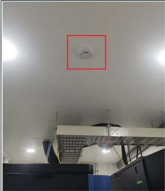
มีเครื่องตรวจจับควันพร้อมใช้งาน