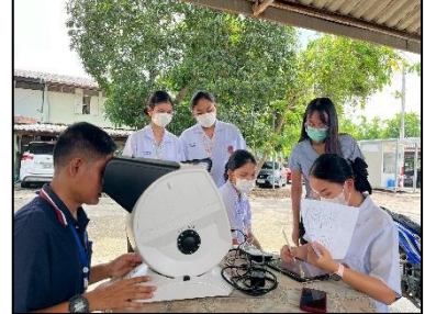
ภาพการตรวจสมรรถภาพการมองเห็น และสมรรถภาพการได้ยิน