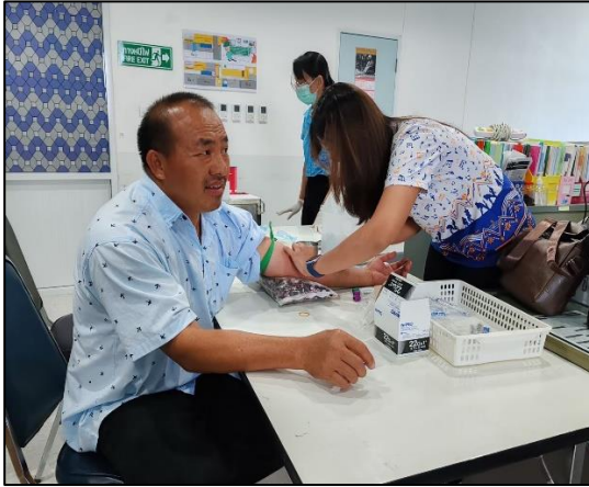
ภาพการตรวจ ตะกั่วในเลือด บุคลากรหน่วยงานเครื่องมือแพทย์