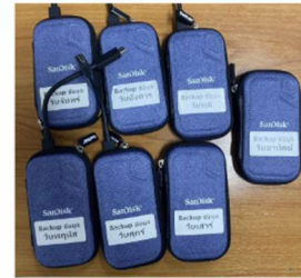
การสำรองข้อมูลแบบ offline (หากตัว offline อยู่ระหว่างการ Back up จะถือว่า online อยู่ในขณะนั้น)