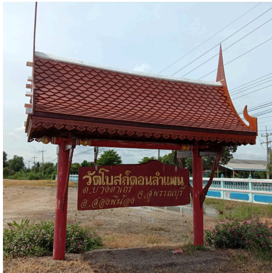
จุดที่ 1 วัดโบสถ์ดอนลำแพน