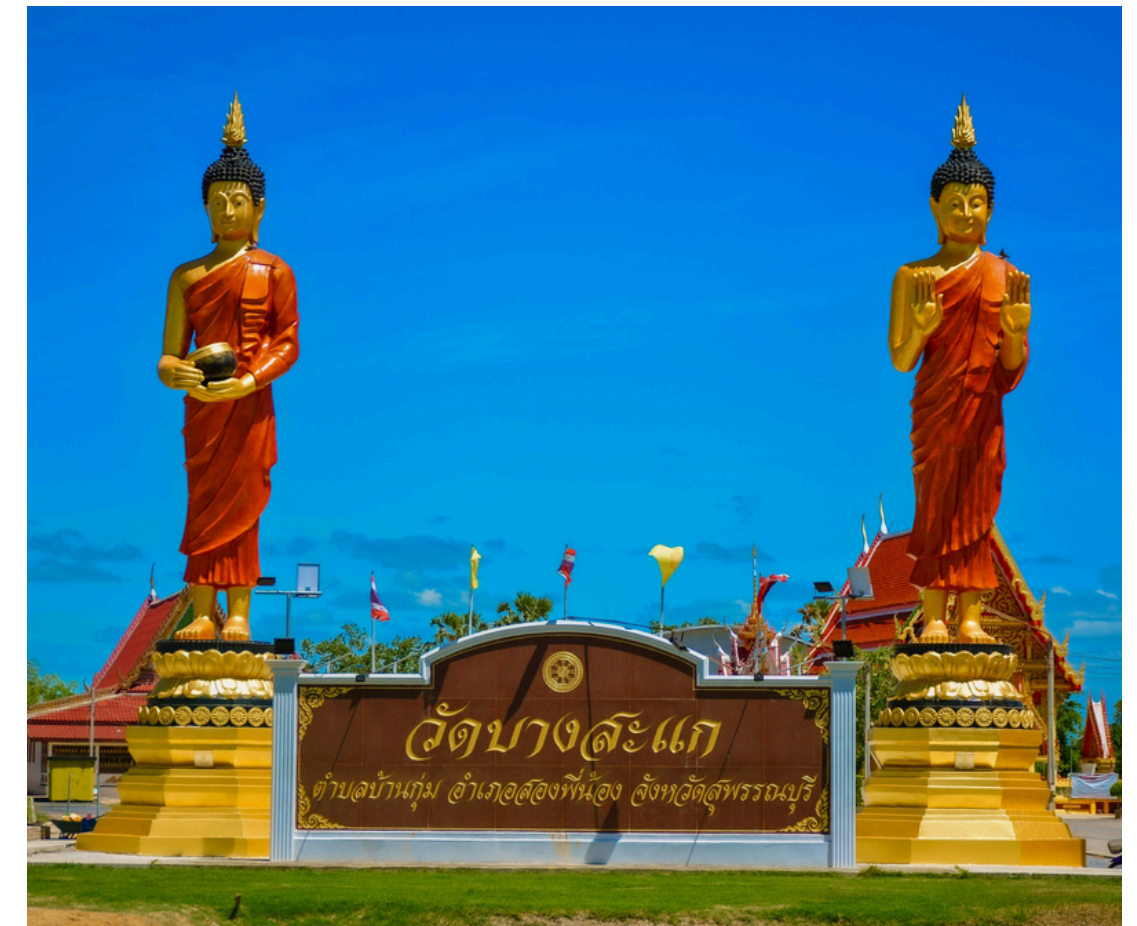
จุดที่ 3 วัดบางสะแก