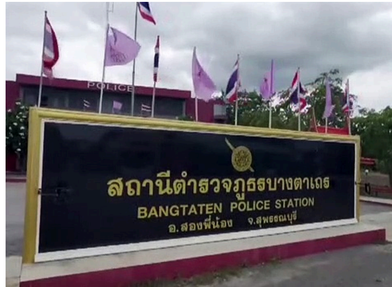
จุดที่ 2 โรงพักบางตาเถร